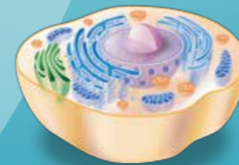
Sección de una célula humana